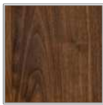
ブラックウォールナット 黒褐色の材で、使い続けていくと色が少しずつ抜けて明るくなっていきます。