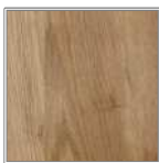
クルミ 黄褐色で明るいものから暗いものまでばらつきがあり小節、シミが入るすこしラフな印象が特長。

ナラ材独特の虎斑がよく現れていて、さらに使い込むほどに深みのある黄褐色になっていく、フリーハンドイマイが提案するもっともスタンダードなタイプのキッチン。