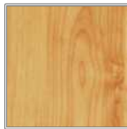
アルダー 暖かな色に仕上がりが、自然に生まれる小さな節が入ることがこの木の特長です。