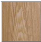
タモ(アッシュ) バットにも使われるほどの粘りのある良材。はっきりとした木目で明るい褐色に仕上がります。