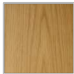
ナラ(オーク) 虎斑が特長の広葉樹最もよく使われている家具材です。