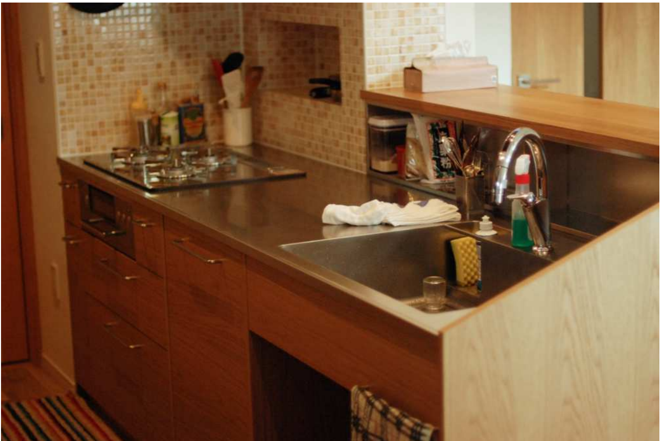
Nさんのキッチンはステンレスのカウンターとその上の無垢材の対面カウンターの高さを変えた変則的なペニンシュラタイプのキッチン。その高さを活かして、ステンレスの箱を入れ込んで、ちょっとした収納にしているのです。