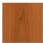
ブラックチェリー 使い始めるとあっという間に赤褐色の飴色に変化する独特の材。優しい木目が特長。